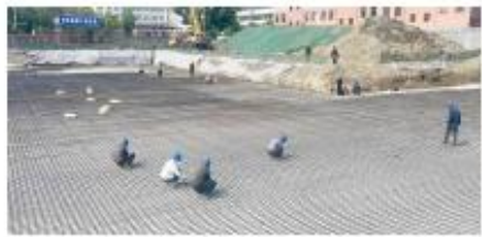
恒昌德服饰有限公司建设现场是热火朝天。

本报讯(融媒体记者 付嘉嘉)近日,在由柯桥籍企业家包小舟投资创建的天门恒昌德服饰有限公司建设现场,机声轰鸣,荷花飞舞,一派火热的建设场景。